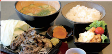
妻地鶏と冷汁御膳