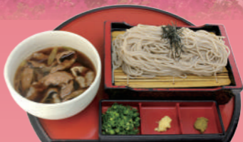
宮崎牛セイロ蕎麦