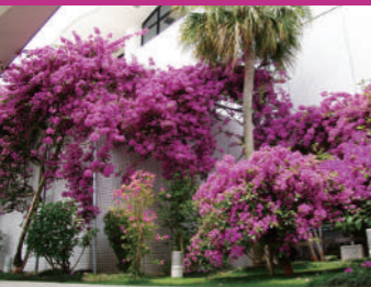
▲満開に咲くブーゲンビリア(6月頃)