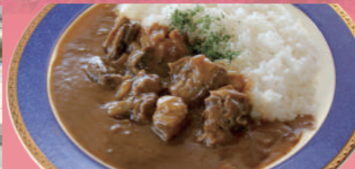
宮崎和牛ゴロゴロカレー