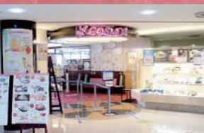
レストラン コスモス