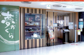
おもてなし 夢かぐら