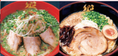
あっさりとんこつ赤・こってりとんこつ黒

宮崎ブーゲンビリア空港内の売店・飲食店をご利用の お客様は、空港前駐車場が、 120分まで無料 になります。 ※120分を超えると通常料金(450円～)となります。